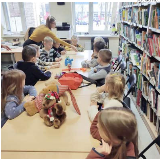
Sensorinių skaitymų metu vaikai per žaidimą įtraukiami į istoriją, tampa jos dalyviais.