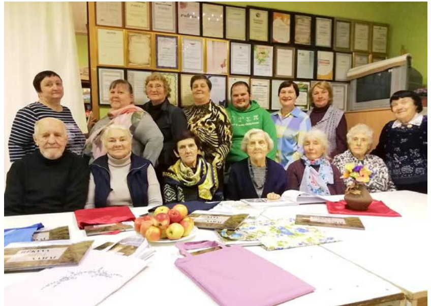
Rėkyvos gyvenvietės bendruomenės nariai džiaugiasi savo išleistu fotoalbumu.

ruomenės žinios“ leidybą, todėl maloniai kviečiame dalintis informacija, kurią galėsime publikuoti mūsų laikraštyje.